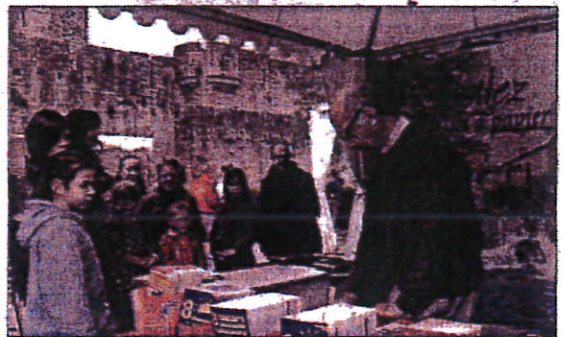
Le Moulin à papier de Brousses était présent au pied de la Cité.

De leur côté, les artisans qui étaient situés sur la place Marcou ont, en effet, vu plus de touristes approcher leurs étals.