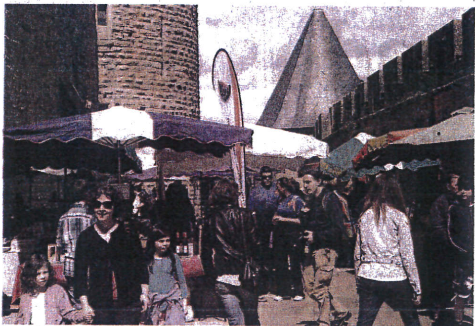
Le marché d'artisans d'art, ici en 2012, sera installé dans les douves et place Marcou.

C'est une belle sortie à faire en famille, seul ou entre amis, aujourd'hui et jusqu'à lundi. Pour ce long week-end pascal, la Cité va bruisser d'activités sous le signe de la médiévalité, avec notamment 35 artisans d'art répartis dans les douves sous le pont-levis, à l'entrée de la Cité, et sur le square de la place Marcou, 18 producteurs de pays qui tiendront leurs stands entre le pont-levis et la porte Narbonnaise, un village touristique sur le Prado (entrée principale de la Cité) et une foule d'animations gratuites dont vous pourrez consulter le détail sur le site www.payscarcassonnais.com , ou à l'Office de Tourisme. On notera pour ce samedi des démonstrations de combat et un défilé médiéval