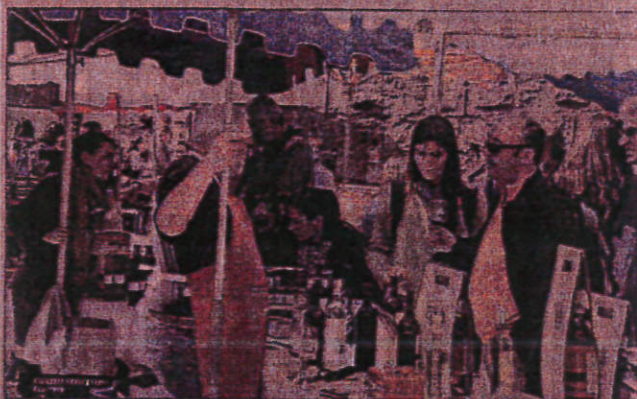
Une vingtaine de producteurs tiennent le marché de Pays. Ch. B.

Depuis hier et jusqu'à lundi soir, la porte narbonnaise de la Cité se met aux couleurs des producteurs locaux.