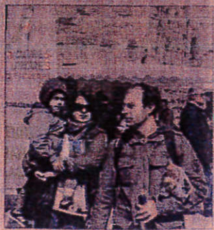
Les touristes au rendez-vous.

Fête du Pays carcassonnais jusqu'à lundi soir, Porte narbonnaise à la Cité. Renseignements sur www.payscarcassonnais.com .