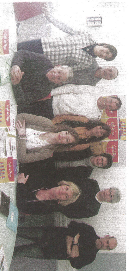
La présentation des cinq cafés de leur territoire dans les locaux du Pays Carcassonnais.

Authenticité, accueil, qualité des produits. Les « Cafés de Pays » se veulent être les véritables ambassadeurs de leur territoire. Lancés voici deux ans dans le Pays Carcassonnais, désormais ils se comptent avec l'arrivée de trois nouveaux, cinq à bénéficier de ce label national. Après « La Marbrerie » à Caunes, « L'au-berge de Ardeilles à Lespina-sière, ce sont « La Rivassol » à La Redorte, « Le salon de Vauban » aux Cammazes et « L'arbre du voyageur » à Palaja qui les ont rejoint. Le café est bien souvent le commerce de proximité qui joue un rôle de lien social. Chaque établissement répond aux mêmes critères et pourtant chacun a sa spécificité, si bien que la clientèle est dépaycée à chaque rencontre tout en étant sûre de trouver le fil conducteur. Implantés aux quatre coins du Pays carcassonnais, ils offrent un maillage parfait pour découvrir toute la variété des paysages, climats, produits... Dans chaque café, les patrons proposent une assiette de pays autour de 15 € à base de produits locaux et les mettent en avant au sein d'un espace vitrine. Ils organisent aussi des manifestations culturelles et mettent à disposition de la clientèle de la documentation touristique en les renseignant sur ce qu'il y a à découvrir. Ces « Cafés de Pays » représentent un atout majeur pour le territoire, aidant à répartir de façon harmonieuse les flux touristiques en créant des échanges entre touristes et habitants des villages.