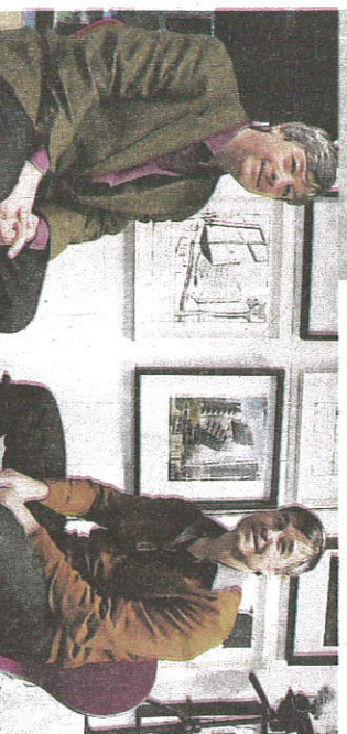
tour de ville