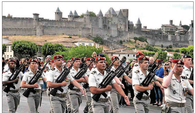
Le défilé, moment incontournable de la fête nationale.

► Toutes ces animations sont gratuites. Attention, le stationnement et la circulation seront réglementés.