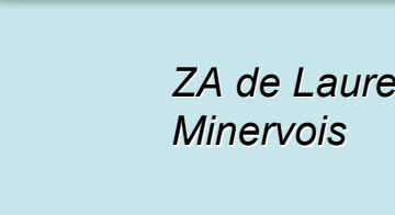
ZA de Laure Minervoises