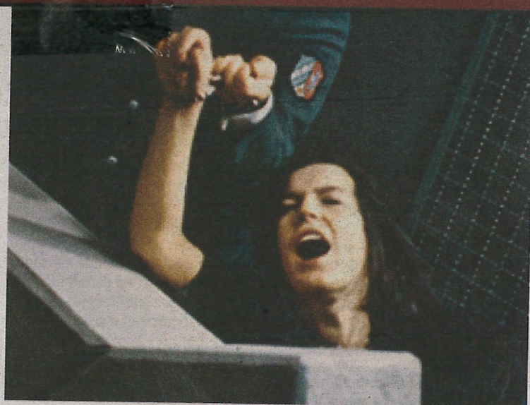
L'opéra est inspiré d'un fait divers qui s'est déroulé aux Etats-Unis en 1975.

Représentations les 15, 18 et 22 avril à 20h. A 15h le 20 avril. Tarifs : de 16,50€ à 86€. Réservations au 05 61 63 13 13.