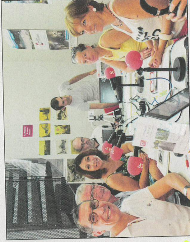
Des élus et des associatifs en direct sur RCF